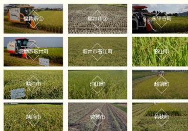
いちほまれ栽培情報